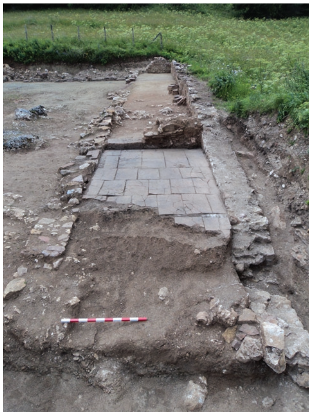
Обр. 2. Бантистерий, доленен на североизток към базиликата, гл. т. от изток.