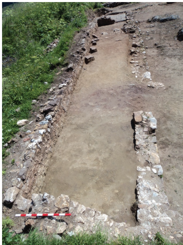
Обр. 3. Северозападно помещение към базиликата, гл. т. от запад.

северозападно помещение до църквата с шир. 1 м, и един на юг, чиято ширина не може да се установи. Стените, отделящи притвора от наоса са с деб. 0,90 м. Запазена е само южната такава, и то в хоросанова подложка върху скалата.