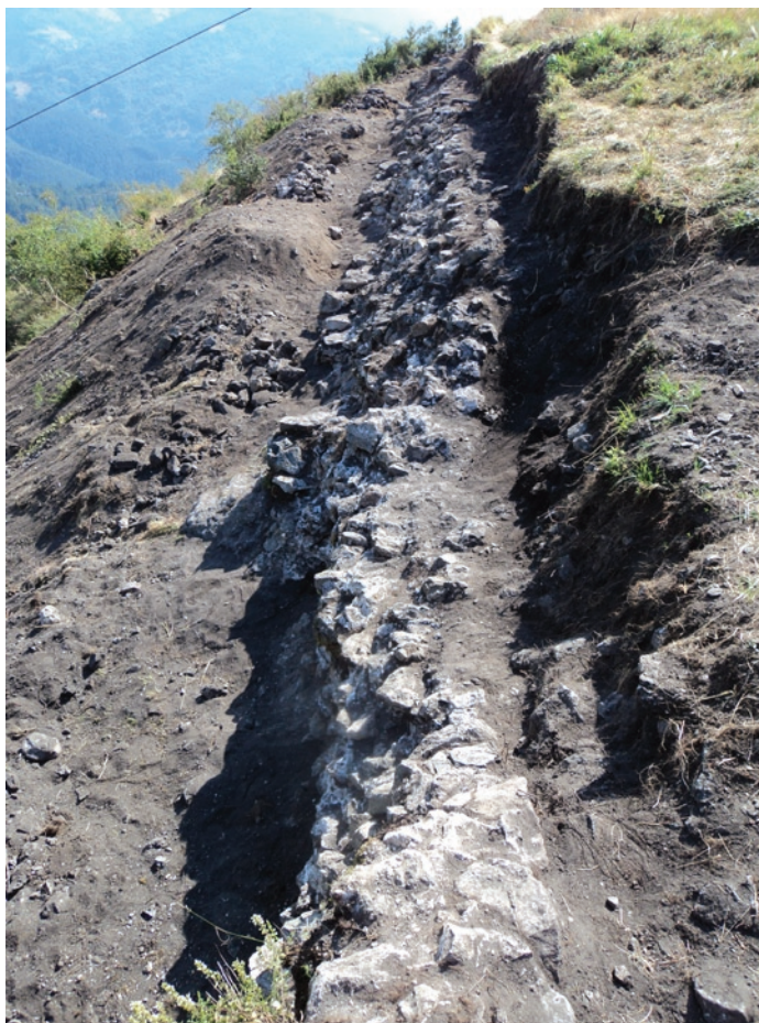
Обр. 3. Трасето на северната крепостна стена след приключване на разкопките, изглед от запад.

В пръстта, натрупана и свлякла се върху стената, се откриха 6 бр. монети и един връх от стрела. Монетите са от различни епохи: медна монета малък номинал на гр. Мароней (II-I в. пр. Хр.); бронзова римска монета от IV в. и четири неопределени средновековни корубести монети. Маронейската монета е от периода, когато на върха е функционирало тракийско скално светилище. Самата крепост като такава има два периода на обитаване – късноантичен (VI в.) и средновековен (XI – XIV в.).